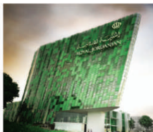
Royal Jordanian HQ - Amman