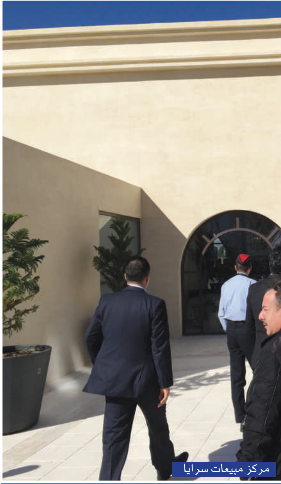
مركز مبيعات سرايا