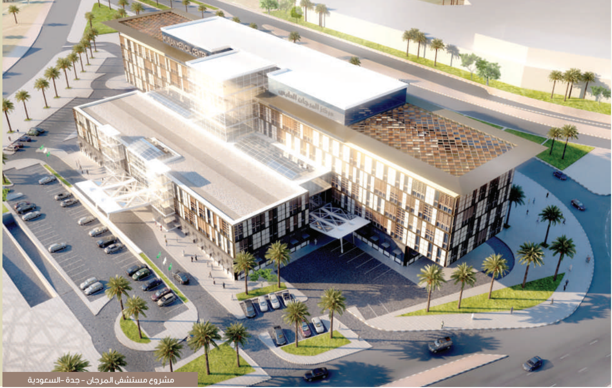
مشروع مستشفى المرجان - جدة - السعودية