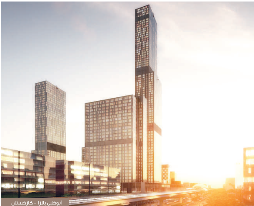
أبو ظبي بللزا - كازخستان

بتعيين خبرات محلية من نفس الدولة التي تعمل بها و«تطعيمها» بخبرات من مكتب المجموعة الموجود في الاردن، بهدف نقل الخبرة والانظمة وحفظ الجودة.