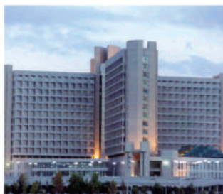
King Abdullah Hospital - Irbid