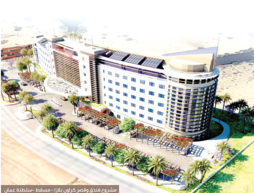
مشروع فندق وقصر كراون بلازا - مسقط - سلطنة عمان

واضاف ان مجموعة اربتك جردانة تتواجد اليوم في كل من المملكة العربية السعودية ودولة الامارات العربية المتحدة وفي سلطنة عمان و دولة قطر و كردستان العراق، بالإضافة الى العديد من الدول الاقليمية والدولية، حيث ان ٢٥ بالمئة من حجم اعمالها هو داخل الاردن و ٧٥ بالمئة هو في الخارج.