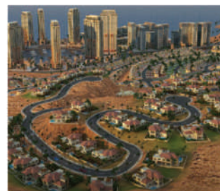
Marsa Zayed - Aqaba

T: +962-6-585 7167 | F: +962-6-582 4532 | Email: aj@aj-group.com | Address: P.O.Box 9532 Amman 11191 Jordan | Website: www.aj-group.com