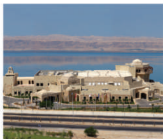
Convention Center - Dead Sea

Our team is experienced in providing professional engineering, architecture, and management services which enable us to define our clients' needs, design solutions to the highest international standards, and deliver our work to the requirements of each client's environment and country.